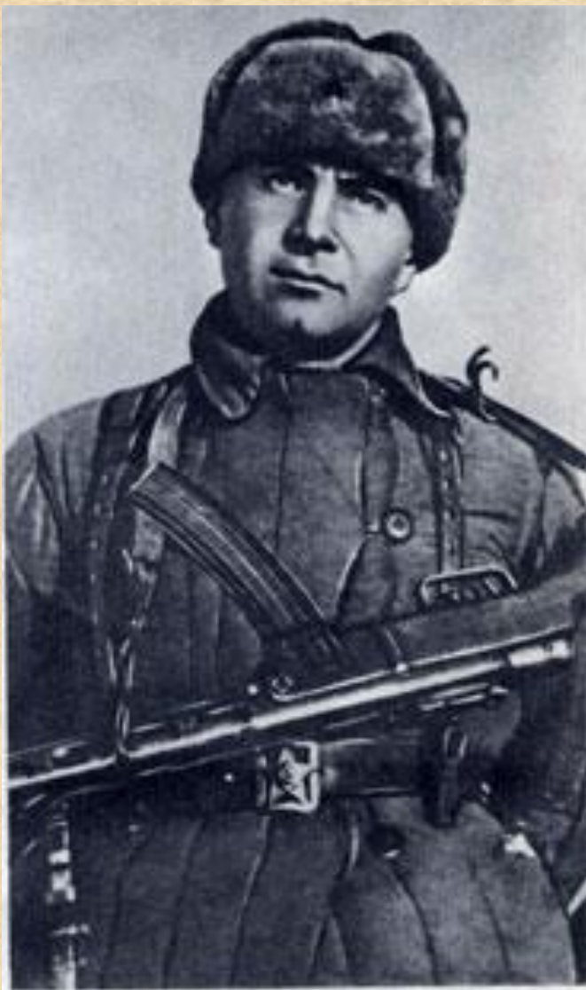
Герой Советского Союза Ц. Л. Куников в дни боёв под Новороссийском (1943 год).